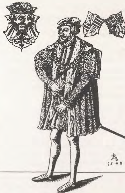
Ferdinand I. Habsburský

✓ Vzpomeňte si, kdo tvořil „prozatímní vládu“ stanovenou čáslavským sněmem, a porovnejte to s tím, které stavy byly v Čechách v 16. století.