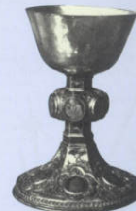
Symbolem husitů byl kalich, z něž se při mši přijímalo víno.

Zdali je tiem zavinił, Že mnohým hřiechy zjevil Z daru milosti božie, Aby pravé pokánie Činili beze lsti?