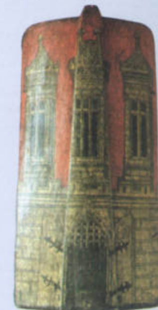
Husitští pěší bojovníci používali pavězy – mohutné dřevěné štíty tak vysoké, že se za nimi pohodlně ukryl dospělý muž. Z těchto pavěz se dala vybudovat přenosná hradba.