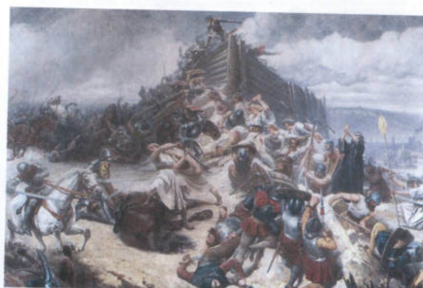
Bitva na Vítkově. Když si obraz prohlédnete podrobněji, zjistíte, že autor sice poměrně rozuměl dobovým zbraním, nikoli však dobové módě. Z které doby se na Vítkově dostal například „husita“ s cepem stojící před srubem?

nechal korunovat českým králem, ale brzy neklidné české země opustil. Neznamenal to však, že by se svých dědických nároků vzdal.