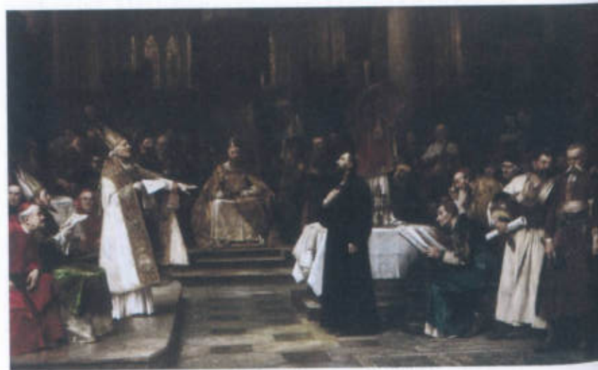
Takto zachytil Husovo slyšení před koncilem známý malíř 19. století Václav Brožík.

V Čechách byl Hus zatím stále v bezpečí. Václav IV. ho nehodlal vydat žádnému církevnímu soudu , protože věděl, že ten by Husa odsoudil jako kacíře . To by pak vrhlo špatné světlo na celé České království i na Václava samotného, protože si nedokáže ve vlastní zemi udělat pořádek. Ale v roce 1414 dostal Jan Hus pozvání na kostnický koncil , aby zde obhájl své názory. Koncil zorganizoval kvůli vyřešení papežského schizmatu král Svaté říše římské a Uher, mladší a schopnější Václavův bratr Zikmund Lucemburský . Ten také vystavil Husovi ochranný glejt na cestu do Kostnice a vymohl mu – když byl hned po příjezdu do Kostnice zatčen a uvězněn – alespoň trojí slyšení u koncilu. Bylo to však málo platné, koncil byl předem rozhodnut, jak s Husem naloží. Hus ani