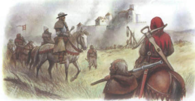
Při obléhání hradu Rábí přišel Žižka o druhé oko.

přijímání pod obojí výměnou za to, že husité budou souhlasit s nástupem Zikmunda Lucemburského na český trůn. A tak byl téhož roku Zikmund znovu korunován českým králem. Král český, uherský a římský se ze své poslední koruny, která mu však jako jediná náležela dědičně, netěšil dlouho. Zemřel už příštího roku a s ním vymřeli Lucemburkové po meči.