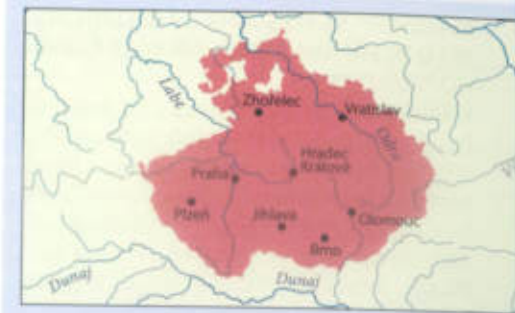
Český stát za Jiřího z Poděbrad