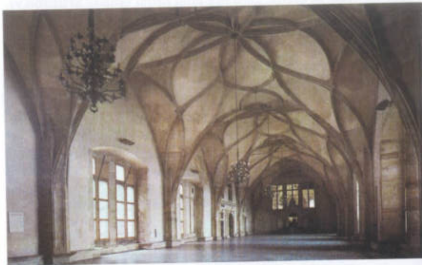
Za Vladislava Jagellonského vznikl v Čechách zvláštní umělecký sloh, vladislavská gotika. (O gotice se více dozvíte v další kapitole.) Krásnou ukázkou tohoto slohu je Vladislavský sál na Pražském hradě; je dlouhý 62 m, široký 16 m a vysoký 13 m. Od roku 1934 se ve Vladislavském sále volí prezident republiky, který zde skládá i slib.