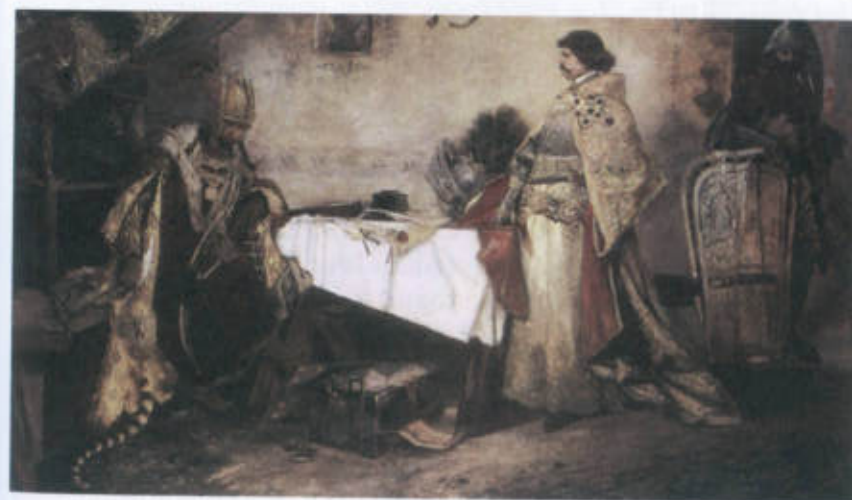
Setkání Jiřího z Poděbrad s Matyášem Korvínem po bitvě u Vilémova zachytil český malíř Mikoláš Aleš.

Spor mezi českým králem a papežem povzbudil přirozeně i Jiřího domácí nepřátele. Katolická šlechta a města zahájily proti králi odboj . Do čela křížáckého tažení vyhlášeného proti Čechám se postavil Matyáš Korvín . Jiří z Poděbrad ho sice v bitvě u Vilémova zabil, ale jakožto svého bývalého zetě (Jiřího dcera zemřela krátce po svatbě s Matyášem při porodu) ho velkoryse propustil na svobodu. Matyáš se však obratem nechal v Olomouci Jiřího protivníky zvolit českým králem .