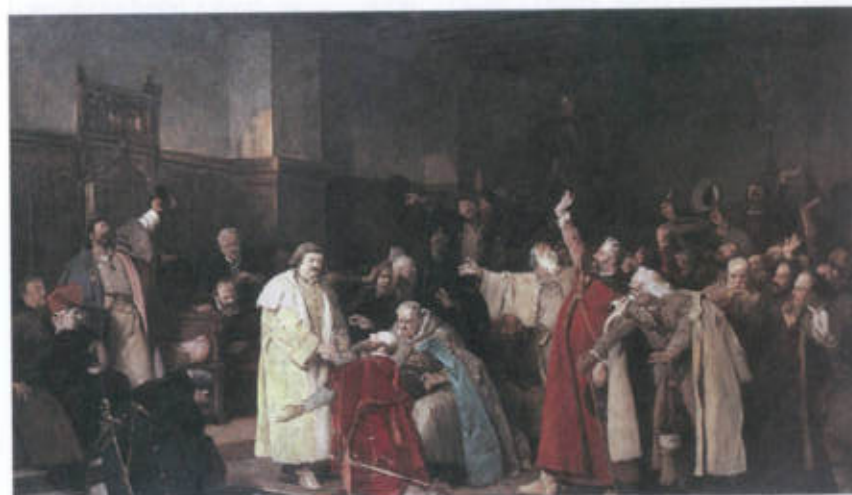
Václav Brožík namaloval i obraz volby Jiřího z Poděbrad českým králem. Volba se odehrávala na radnici Starého Města pražského. Najděte Jiřího na obraze.

Oba státy, České království i Uhry, vyřešily nástupnictví stejně: nového krále si zvolily . V Čechách byl v roce 1458 zvolen králem Jiří z Poděbrad . Protože uherský správce Jan Hunyadi mezitím zemřel, zvolili v Uhrách králem jeho syna Matyáše Hunyadiho , známého pod jménem Korvín .