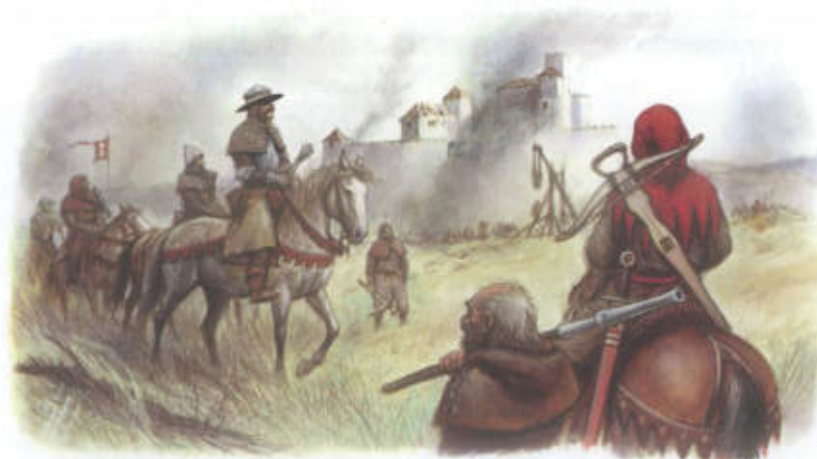
Při obléhání hradu Rabí přišel Žižka o druhé oko.

přijímání pod obojí výměnou za to, že husité budou souhlasit s nástupem Zikmunda Lucemburského na český trůn. A tak byl téhož roku Zikmund znovu korunován českým králem. Král český, uherský a římský se ze své poslední koruny, která mu však jako jediná náležela dědičně, netěšil dlouho. Zemřel už příštího roku a s ním vymřeli Lucemburkové po meči.