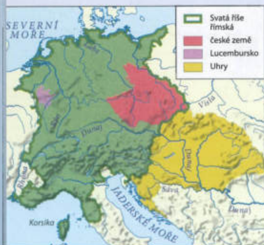
Rozsah území ovládaného Zikmundem Lucemburským v roce 1436

Na časlavském sněmu byla zvolena dočasná vláda ve složení: 8 měšťanů, 7 rytířů, 5 pánů.