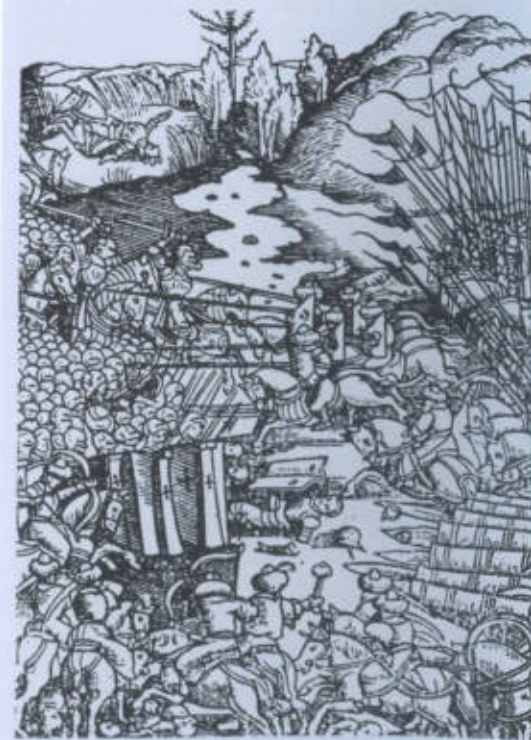
Bitva u Moháče