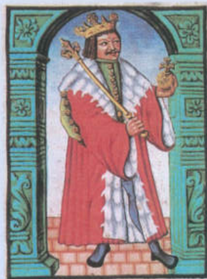
Jiří z Poděbrad

sňatku však nedošlo, protože sedmnáctiletý král náhle zemřel . A protože neměl ani sourozence, ani žádné potomky, byla situace mnohem komplikovanější, než když zemřel jeho děd.