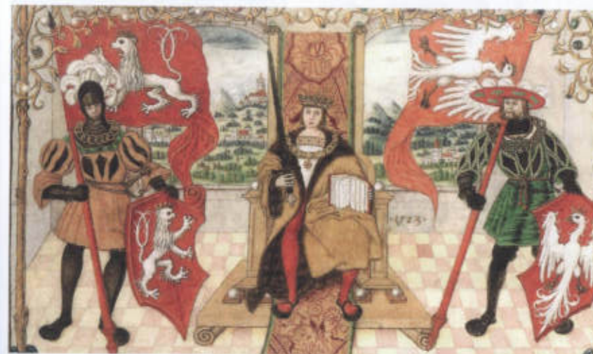
Král Ludvík Jagellonský