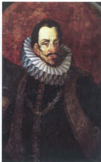
Čeští panovníci vládoucí na počátku třicetileté války: Matyáš (vlevo) a Ferdinand II.